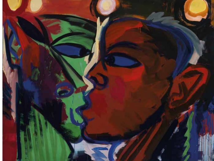
Rainer Fetting - Der Kuss IV (1981)